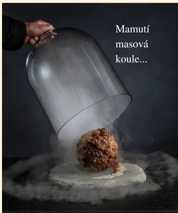
Mamutí masová koule...